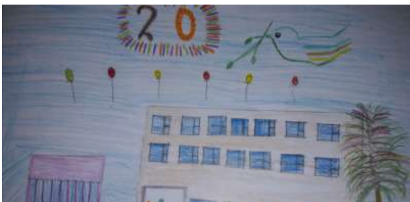
Ilja Poležajev, 5 a klasė

Aš norėčiau, kad mano ateities mokykla būtų išmani. Norėčiau, kad vietoj sąsiuvinio būtų viena planšetė, o vietoj knygų taip pat koks nors išmanus prietaisas. Taip būtų daug paprasčiau. Namų darbų apimtis nedidelė. Žinoma, būtų puiku, jei mokytojai neužduotų skaityti knygų per vasarą. Turėtų būti