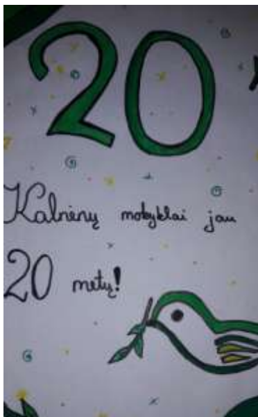
Brigita Jagminaitė, 5 c klasė